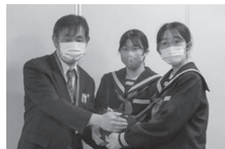
山口市立宮野中学校