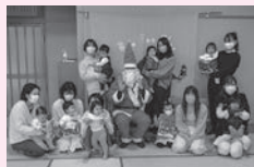
子育てサロン支援事業