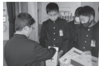
山口市立仁保小学校