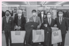
児童養護施設退所者応援事業

皆様にご協力いただいた歳末たすけあい募金は、以下の通り活用させていただきました。(令和5年2月末日)