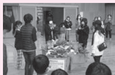
地域のつながりを絶やさない事業