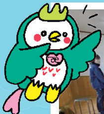
ふれっぴー (山口市社協イメージキャラクター)

生活支援コーディネーター(地域支え合い推進員)をご存知ですか? 高齢者が住みやすい地域づくりをお手伝いします。