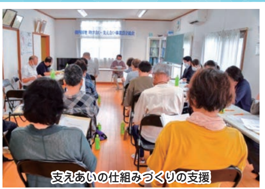
支えあいの仕組みづくりの支援