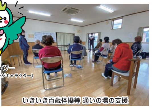
いきいき百歳体操等 通いの場の支援