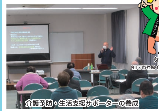
介護予防・生活支援サポーターの養成