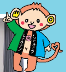
タスクン (山口市社協イメージキャラクター)