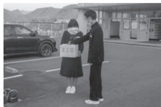
山口市立大内中学校